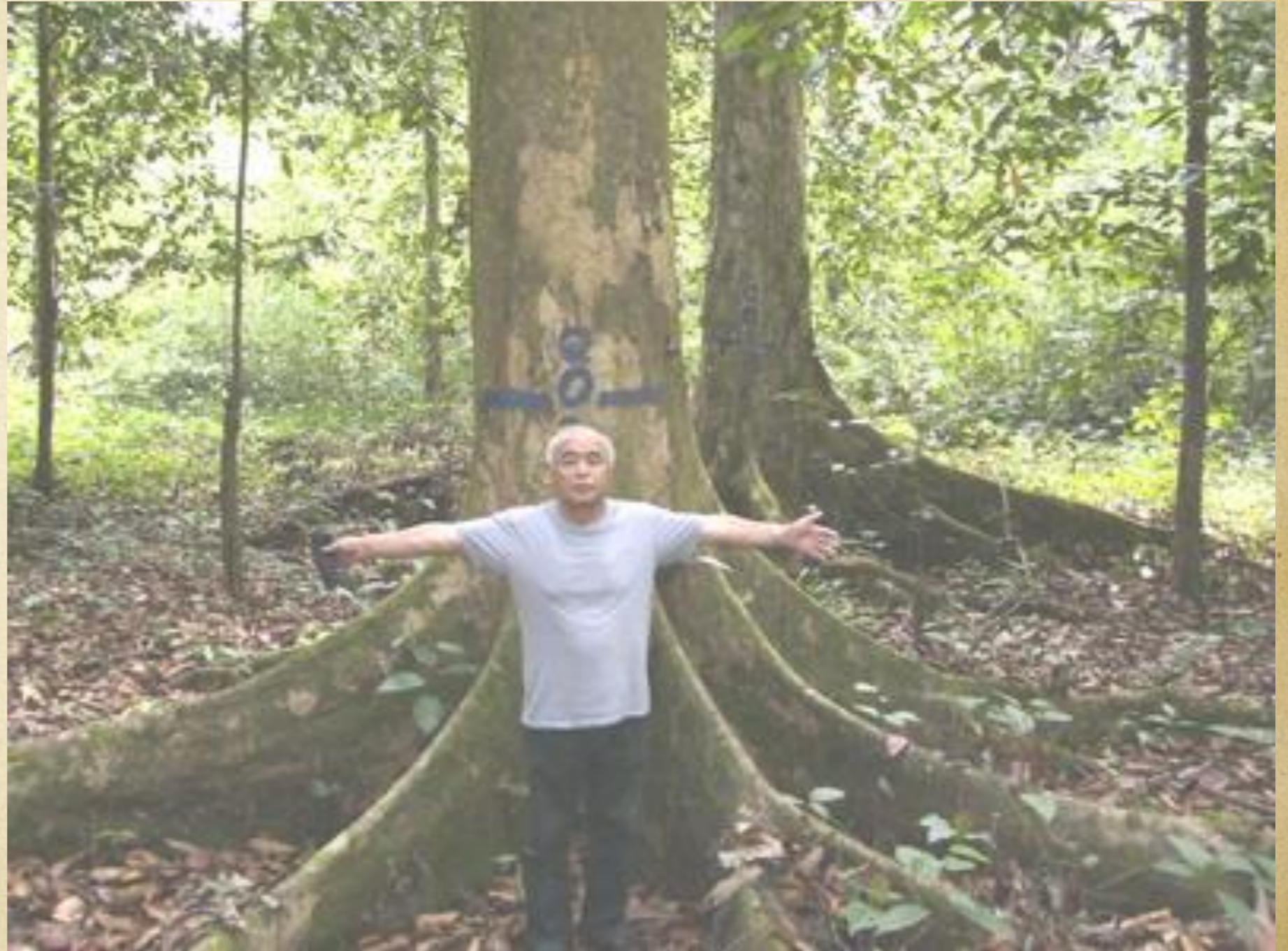
8) 植林後70年の樹木 ( 樹高: 35m )